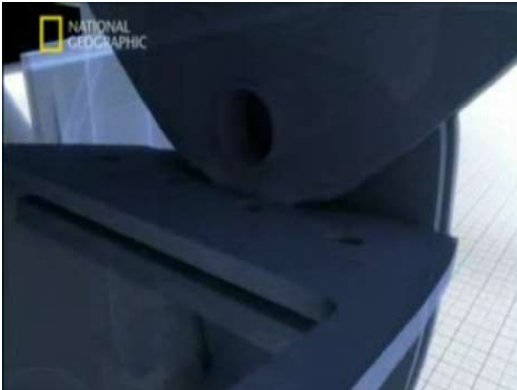
Схема №6. Вид пилона и скобы крыла во время отсоединения, момент образования трещины на пилоне